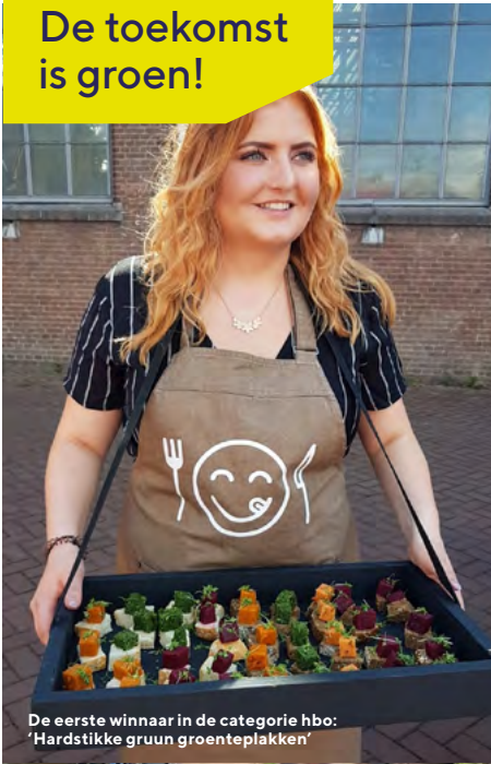
De eerste winnaar in de categorie hbo: 'Hardstikke gruun groenteplakken'